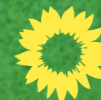
Titelbild: Anne Hüwe

BÜNDNIS 90/DIE GRÜNEN • Ortsverband Neuenkirchen info@gruene-neuenkirchen.de • www.gruene-neuenkirchen.de